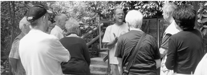
Visite du Papiorama

Les associations d'aphasiques sont autonomes, indépendantes et leur type d'organisation diffère d'un groupe à l'autre. Certains groupes se définissent comme des associations à part entière, d'autres comme des groupes d'entraide. Certains sont gérés par les personnes aphasiques elles-mêmes, d'autres par des proches ou par des logopédistes. De nombreux groupes sont composés de personnes aphasiques uniquement, d'autres groupes réunissent personnes aphasiques et proches, d'autres, enfin, sont composés uniquement de proches. « aphasie suisse » se donne pour mission de soutenir les différents groupes sur le plan administratif.