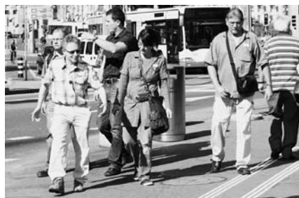
Participants à la sortie du cours de photographie

Comme les années précédentes, les responsables des associations de personnes aphasiques ont, en 2010, rencontré le comité d'« aphasie suisse » pour un échange des points de vue. Le 26 février 2010, sept personnes ont participé à cette rencontre qui s'est déroulée à Sion pour la partie romande. En ce qui concerne la Suisse allemande, dix-neuf personnes ont fait le voyage