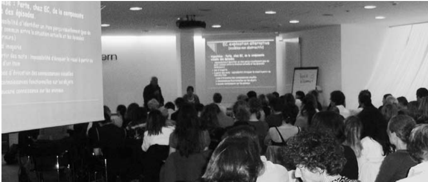
Présentation des travaux de recherche