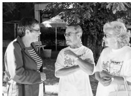
Madame la conseillère aux Etats L. Maury Pasquier (à gauche)