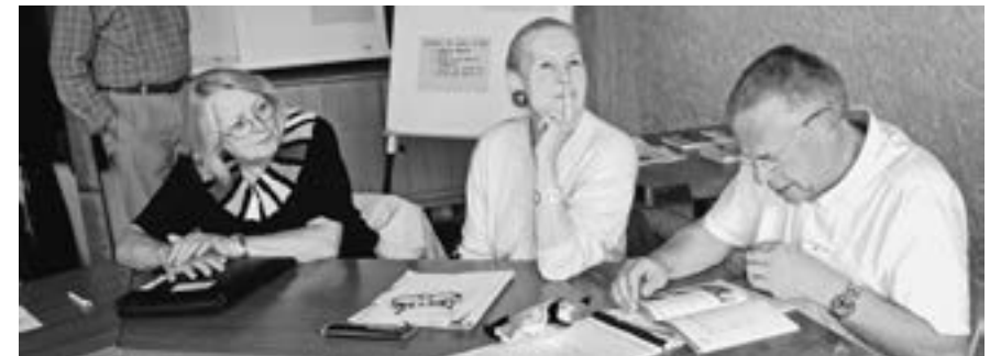
Discussion en groupe

Trente-deux personnes ont pris part à la rencontre des animateurs de groupes d'entraide de Suisse alémanique du 16 mars 2012 à Lucerne. Quant à la rencontre des animateurs de suisse romande du 21 mai à Lausanne, elle a rassemblé 13 personnes.