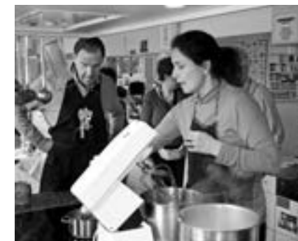
Une animatrice engagée

L'offre de cours a été étoffée et complétée par de nouveaux thèmes au cours de l'année 2012. Neuf cours pour personnes aphasiques ont eu lieu sur l'ensemble de la Suisse. Grâce à l'engagement d'animateurs qualifiés et impliqués, chaque participant est pris en charge et stimulé d'après ses besoins. Dans les cours d'«aphasie suisse», les aphasiques découvrent leurs propres facultés, acquièrent de nouvelles compétences et améliorent leur estime de soi.