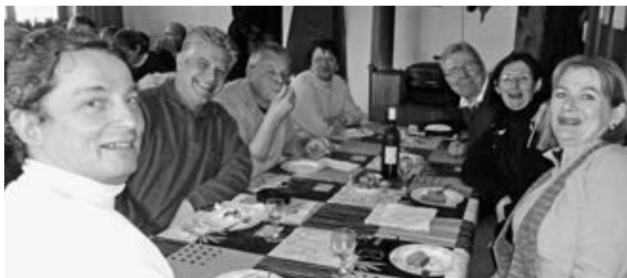
Le groupe d'entraide AGEVA cultive la joie de vivre