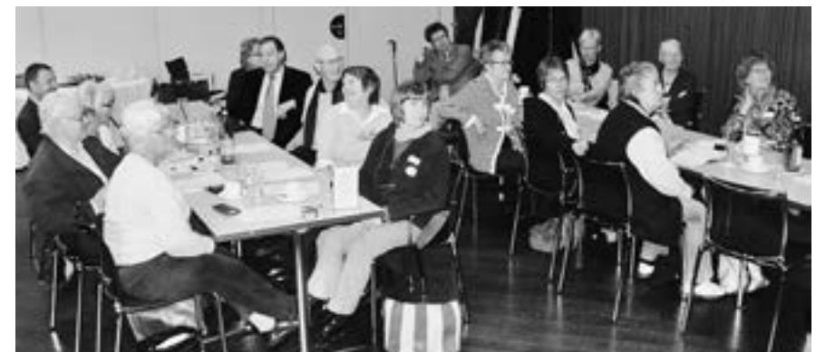
Une audience captivée lors de la mise en commun