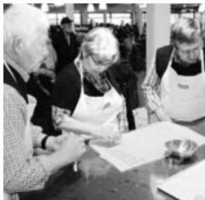
Développer de nouvelles facultés

Les groupes d'entraide rattachés à «aphasie suisse» sont indépendants et s'organisent comme ils l'entendent. Ils ont à leur tête des personnes aphasiques, des proches ou des logopédistes. «aphasie suisse» informe, coordonne et met en réseau les différents groupes. Elle leur apporte également un soutien administratif.