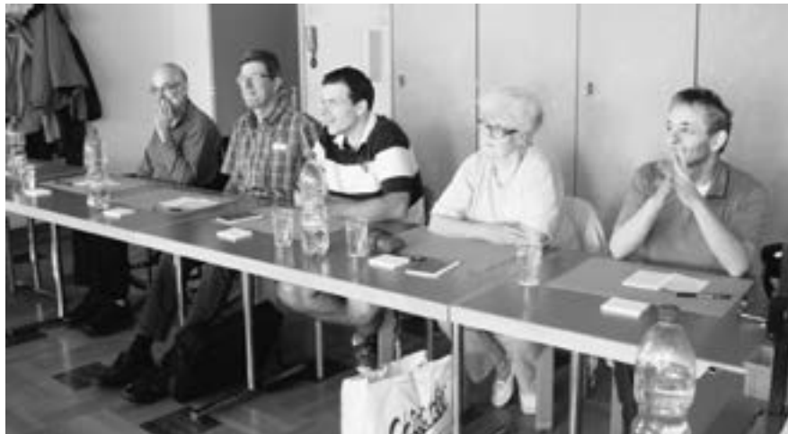
Des auditeurs attentifs