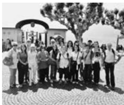
Excursion du groupe d'entraide Tessin