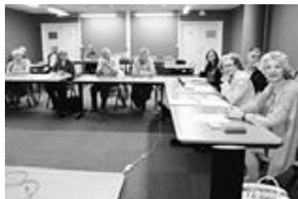
L'AIA à Toulouse

Nous nous sommes rendus au mois de juin dernier à Toulouse pour représenter la Suisse lors de l'Assemblée générale 2012 de l'association internationale de l'aphasie (AIA). Cette association vise à mettre en contact les organisations des différents pays afin qu'elles puissent s'engager dans un effort commun pour mieux faire connaître l'aphasie auprès du grand public.