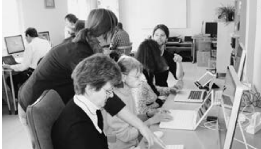
Découvrir ses propres forces