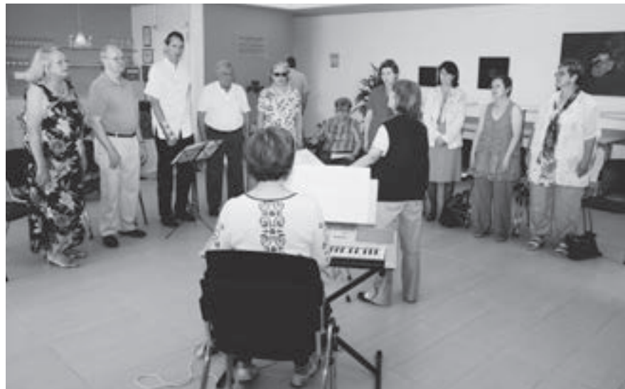
Chœur d'aphasiques de Suisse romande

Constatant le succès du projet Chœurs et le besoin exprimé par nombre de personnes aphasiques de pouvoir chanter, «aphasie suisse» a fondé d'autres chœurs d'aphasiques. C'est ainsi que trois nouveaux chœurs d'aphasiques ont été créés en 2012, dans les régions d'Argovie, de Soleure et du Tessin.