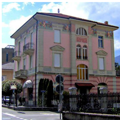
Luogo sala prove: Scuola di Musica Moderna HMI