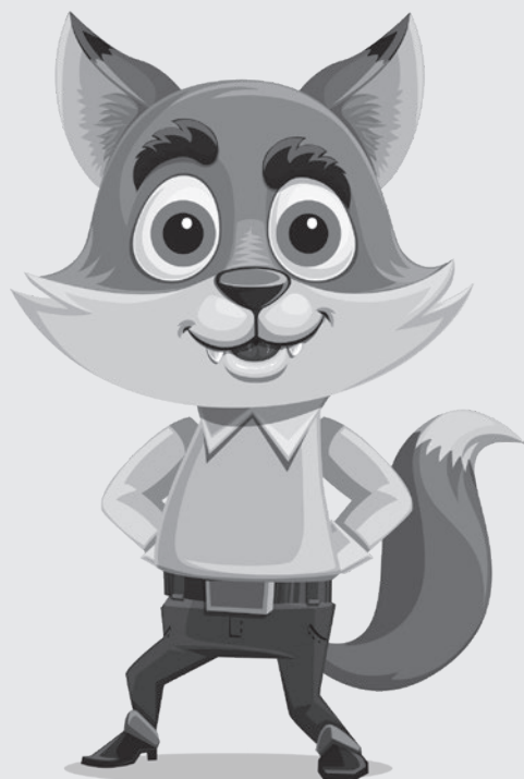
Floki, la nouvelle petite mascotte