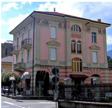
Scuola die musica (HMI), via Cancelliere Molo 9a, 6500 Bellinzona